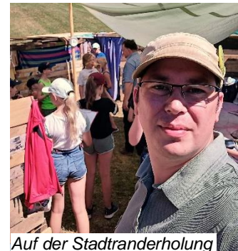
Auf der Stadtranderholung

Schon bevor ich nach München zog, war es für mich wichtig für andere Menschen da zu sein. So wechselte ich in der Kulturwerkstatt Kaufbeuren auch auf die Betreuungsseite und half Kinder und Jugendliche pädagogisch zu begleiten, bei den Produktionen die Technik zu führen und auch Regieassistenten zu führen. Als besonderes Highlight durfte ich zwei Jahre lang die Regie beim Einzug des Kaisers am Kaufbeurer Tänzelfest führen. Aber auch der Stadtranderholung blieb ich verbunden und begann dort 1999 als Betreuer. Dieses Engagement führte ich auch in meiner Zeit in München weiter. Als Gründungsmitglied von Artistica Anam Cara war meine Teilnahme am Tänzelfest jedes Jahr natürlich Pflicht. Nach meinem Umzug nach München wollte ich mich auch dort engagieren und so wurde ich gleich zu Beginn