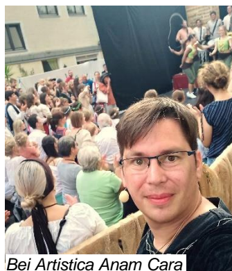
Bei Artistica Anam Cara

meiner Ausbildung Mitglied der Werkfeuerwehr des BKH Haar. Bis auf die Tätigkeit bei der Feuerwehr bin ich in allen Ehrenämtern auch heute noch aktiv. Als Mitglied des Fördervereins der Kulturwerkstatt findet man mich immer wieder an der Theaterkasse. Dieses Jahr durfte ich nach längerer familiär bedingter Pause wieder aktiv als Betreuer bei der Stadtranderholung dabei sein und bei Artistica Anam Cara den Aufbau des Standes Lagerleben unterstützen und zwei Abende auf der Bühne moderieren. Neben all dem habe ich meine alte Leidenschaft für das Theater wiederentdeckt und stehe seit 2019 beim Theater Kaufbeuren e.V. wieder auf der Bühne.